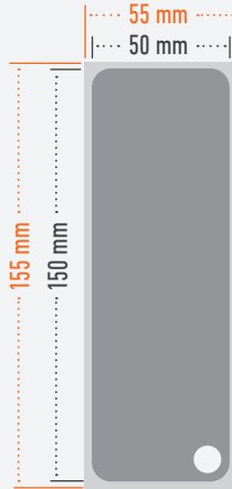
Druck im Anschnitt bleed